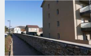
COUVARTINE : LAISSE BÉTON

Combien de temps encore faudra-t-il attendre pour que le mur en pierres bordant les nouvelles résidences du Jardin des Pages soit terminé ? Un lit de ciment recouvre actuellement le dessus des pierres. Il lui manque sa couvartine, prévue dès le début et imposée par l'Architecte des Bâtiments de France. Ce mur en pierres a été déplacé dans le cadre de la construction, c'est le seul témoin de la propriété Montginoux, il est grand temps de le terminer.